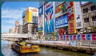
ชินโซบาชิ