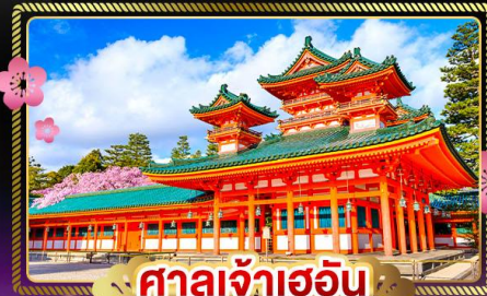
ศาลเจ้าฮอน