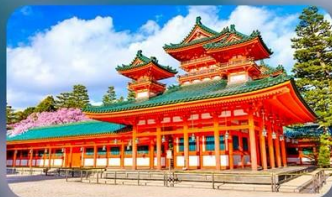
ศาลเจ้าเฮอัน